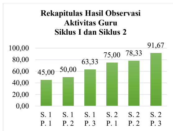
Gambar 2. Diagram Hasil Observasi Guru Siklus I ke Siklus II

Aktivitas siswa juga menunjukkan peningkatan yang signifikan, terutama dalam hal partisipasi dan motivasi belajar. Aktivitas siswa pada pra-siklus masih rendah, dengan mayoritas aspek (57,14%) berada pada kategori "kurang." Siswa kurang antusias dalam membaca dan cenderung pasif selama pembelajaran. Pada Siklus I, aktivitas siswa meningkat, dengan 7,14% aspek mencapai kategori "sangat baik." Siswa mulai menunjukkan antusiasme dalam membaca cerita dari Big Book dan merangkum isi cerita secara sederhana. Pada Siklus II, aktivitas siswa meningkat drastis, dengan 64,29% aspek mencapai kategori "sangat baik." Siswa lebih aktif dalam membaca, menjawab pertanyaan, dan berdiskusi tentang cerita dalam Big Book. Media Big Book berhasil menarik minat siswa, sehingga mereka lebih termotivasi untuk berpartisipasi dalam proses pembelajaran. Media Big Book memiliki dampak positif terhadap aktivitas siswa karena karakteristiknya yang menarik dan interaktif. Cerita bergambar besar memicu imajinasi siswa dan membuat mereka lebih tertarik untuk membaca. Selain itu, kegiatan seperti diskusi kelompok dan prediksi alur cerita juga membantu siswa mengembangkan keterampilan berpikir kritis .