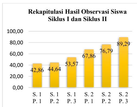
Gambar 3. Diagram Hasil Observasi Siswa Siklus I ke Siklus II

Aktivitas siswa juga menunjukkan peningkatan yang signifikan, terutama dalam hal partisipasi dan motivasi belajar. Aktivitas siswa pada pra-siklus masih rendah, dengan mayoritas aspek (57,14%) berada pada kategori "kurang." Siswa kurang antusias dalam membaca dan cenderung pasif selama pembelajaran. Pada Siklus I, aktivitas siswa meningkat, dengan 7,14% aspek mencapai kategori "sangat baik." Siswa mulai menunjukkan antusiasme dalam membaca cerita dari Big Book dan merangkum isi cerita secara sederhana. Pada Siklus II, aktivitas siswa meningkat drastis, dengan 64,29% aspek mencapai kategori "sangat baik." Siswa lebih aktif dalam membaca, menjawab pertanyaan, dan berdiskusi tentang cerita dalam Big Book. Media Big Book berhasil menarik minat siswa, sehingga mereka lebih termotivasi untuk berpartisipasi dalam proses pembelajaran. Media Big Book memiliki dampak positif terhadap aktivitas siswa karena karakteristiknya yang menarik dan interaktif. Cerita bergambar besar memicu imajinasi siswa dan membuat mereka lebih tertarik untuk membaca. Selain itu, kegiatan seperti diskusi kelompok dan prediksi alur cerita juga membantu siswa mengembangkan keterampilan berpikir kritis .