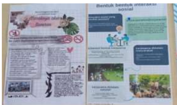
Gambar 1. Poster berisi materi pembelajaran ringkas dan Gambar

Media pembelajaran merupakan alat bantu atau wahana pembelajaran yang membantu guru dalam menyampaikan materi pembelajaran. Media pembelajaran yang digunakan informan beragam. Mulai dari media dua dimensi berupa poster, gambar, kartu sampai dengan media pembelajaran berbasis IT. Media ini dapat digunakan untuk menjelaskan materi pembelajaran dan juga dapat digunakan siswa mempelajari materi pembelajaran secara mandiri. Penggunaan media pembelajaran yang beragam dapat membantu guru dalam pembelajaran berdiferensiasi menyesuaikan dengan kebutuhan dan gaya belajar siswa. Pemahaman terhadap materi pembelajaran juga harus dimiliki guru untuk dapat memilih media pembelajaran yang tepat.