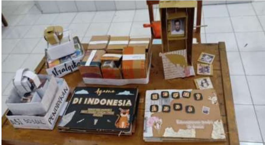
Gambar 7. Diferensiasi produk pembelajaran

kreasi hasil karya yang beragam berupa scrap book, piramida stratifikasi dan kotak simulasi mobilitas sosial dengan menggunakan katrol sederhana.