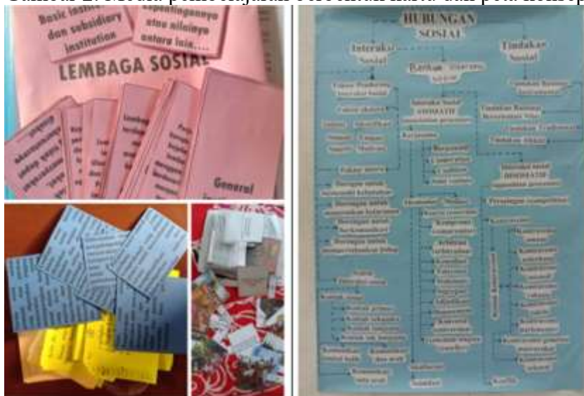
Gambar 2. Media pembelajaran berbentuk kartu dan peta konsep.

galeri walk. Informan memberi arahan dan contoh poster, kelompok siswa menyusun poster kelompok. Siswa memasang poster pada area yang ditentukan guru dan secara bergantian mempelajari poster kelompok lain. Informan juga menggunakan kartu berisi soal, deskripsi konsep atau gambar untuk mendukung model pembelajaran yang dilaksanakan. Misalnya kartu untuk pembelajaran kooperatif dengan model pembelajaran make a match , cooperatif script sampai digunakan untuk main tebak-tebakan dengan siswa. Media lain juga dipakai berupa peta konsep yang disusun oleh siswa dimana guru menyiapkan konsep atau istilah yang akan dimasukkan siswa dalam peta konsep yang mereka susun.