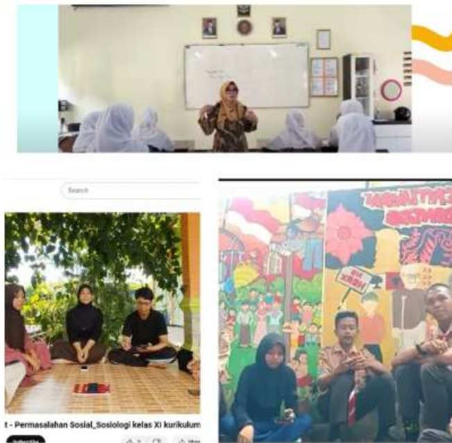
Gambar 6. Pelaksanaan pembelajaran dan kegiatan siswa

Walaupun problem hanya seputar partikularisme dan eksklusifisme, namun pada pelaksanaannya, guru memberikan kebebasan pada siswa untuk membahas berbagai masalah sosial yang ditemui.