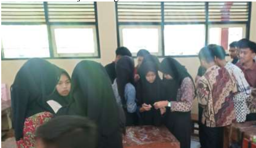
Gambar 4. Pembelajaran dengan make a match

Kooperatif learning dengan menggunakan kartu yang dibuat guru dengan menggunakan model pembelajaran Make a match . Pada pembelajaran yang dilaksanakan guru, siswa di beri kartu berisi soal dan jawaban, dimana mereka diminta untuk mencari kartu lain yang dipegang temannya dengan soal dan jawaban yang match (sesuai) dengan kartunya. Pada siklus pertama siswa diberi waktu 5 menit untuk menemukan kartu yang match , kemudian setelah semua siswa duduk berpasangan guru dan siswa bersama-sama mencocokkan kartu.