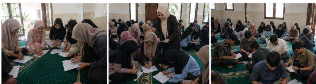
3. Identifikasi Pikiran Negatif