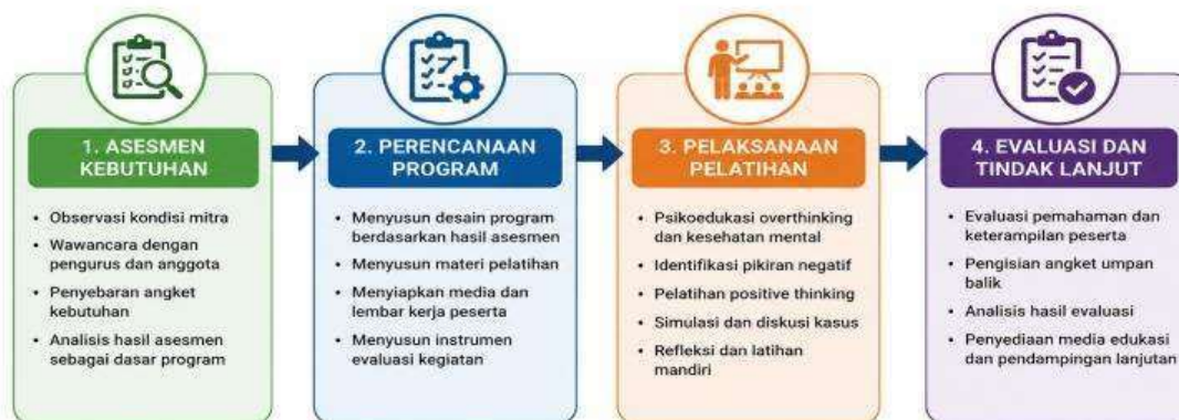
Gambar 1. Tahapan Pelaksanaan Pengabdian

Kegiatan pengabdian kepada masyarakat ini dilaksanakan pada bulan April 2026 di Masjid "Ijo" Summersari dengan sasaran sebanyak 34 anggota Remaja Masjid "Ijo" Summersari. Program ini dirancang sebagai upaya preventif untuk meningkatkan kemampuan remaja dalam mengelola kecenderungan overthinking melalui pelatihan positive thinking . Metode yang digunakan dalam kegiatan ini meliputi psikoedukasi, diskusi kelompok, refleksi diri, simulasi kasus, dan latihan pengelolaan pikiran negatif. Seluruh rangkaian kegiatan dilaksanakan melalui empat tahapan utama sebagaimana disajikan pada Gambar 1.